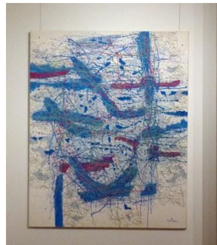
no title 小谷公清